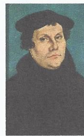
Martin Luther in Wittenberg

Die Dauerausstellung "Martin Luther - Leben, Werk und Wirkung" zeigt Martin Luther in Wittenberg, den Alltag der Familie Luther und die Wirkungsgeschichte des Reformators. Herzstück des Rundgangs ist die Lutherstube, die auch nach dem Verkauf des Hauses an die Universität 1565 weitgehend im Originalzustand belassen wurde. Bis auf wenige Ausnahmen enthält die Ausstellung nur zeitgenössische Originale. Das Lutherhaus steht auf der Liste des UNESCO-